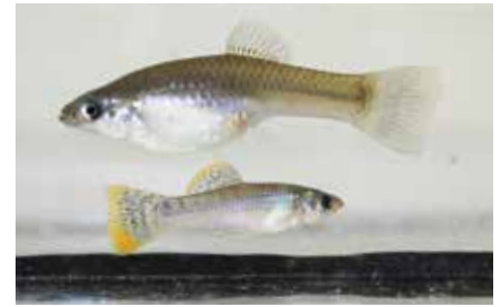
Mutige Männchen (gelb-orange Flossen) der Art Poecilia mexicana haben Vorteile in der Partnersuche.

Die Ergebnisse schienen eindeutig: Mutige Männchen haben stets die Nase vorn. Doch bei genauerer Betrachtung spielte auch die Risikobereitschaft der wählenden Weibchen in die Entscheidung mit hinein. Mutige Weibchen zeigten die stärkste Präferenz für mutige Männchen, während die Präferenz bei schüchternen Weibchen