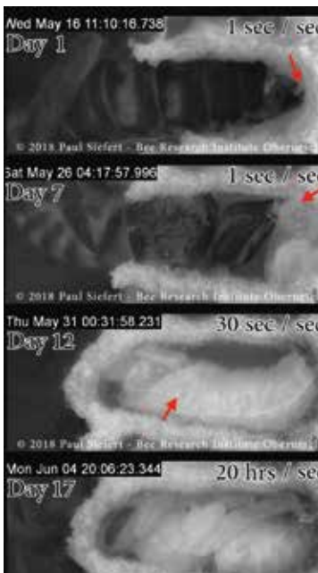
Langzeitvideos zeigen die »Kinderstube« der Bienen im Stock.

Honigbienen haben ein komplexes Brutverhalten: Sobald die Bienenlarve aus dem Ei geschlüpft ist, wird sie sechs Tage lang von einer Ammenbiene gefüttert. Dann verschließt die Ammenbiene die Wabe (Brutzelle) mit einem Wachs-