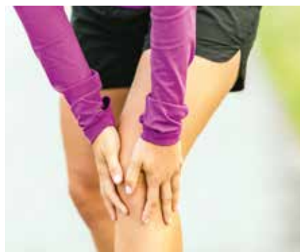
Keine Bagatelle: Muskelschmerzen einer Läuferin.