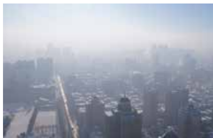
Beim Wintersmog in Mega-Cities (hier Harbin in China) entstehen große Mengen an Feinstaub aus Autoabgasen.

Am Teilchenbeschleuniger CERN in Genf haben Wissenschaftlerinnen und Wissenschaftler im internationalen Atmosphären-Forschungsprojekt CLOUD in einer Klimakammer Bedingungen nachgestellt, die in Mega-Cities herrschen. »Wir haben beobachtet, dass die Nanopartikel innerhalb weniger Minuten sehr rasch anwachsen. Sie